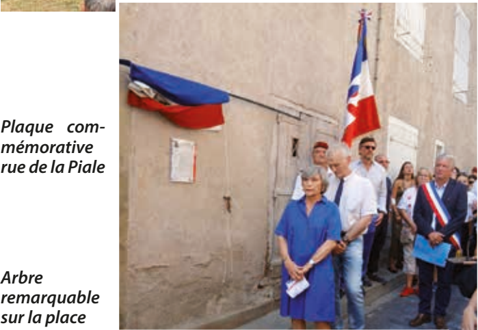
Plaque commémorative rue de la Piale