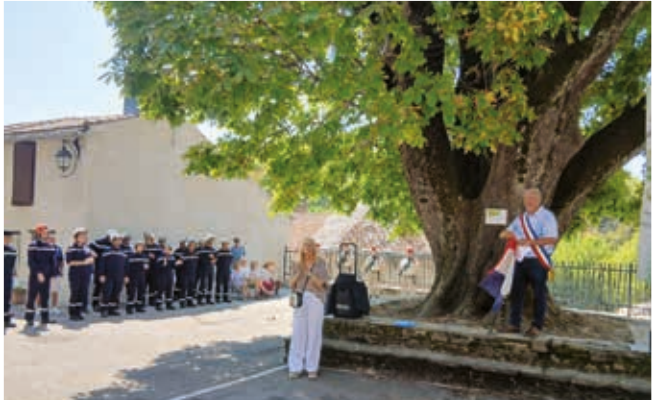
Arbre remarquable sur la place

* 11 novembre avec cette année la participation des enfants